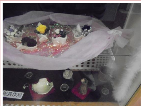
プリザーブドフラワー・陶芸作品